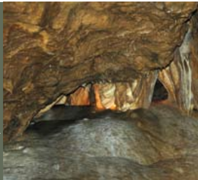
Comblain Au Pont

Volg de wegwijzers vanaf het 'Bureau du Tourisme', Place Leblanc, 1 in 4170 Comblain-au-Pont.